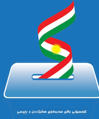
كۆمىسيۆنى بايلى سەر بەخۆي ھەلبۇزاردن و راپرسى

كۆمىسيۆنى بايلى سەر بەخۆي ھەلبۇزاردن و راپرسى المفوضية العليا المستقلة للانتخابات و الاستفتاء The Independent High Elections and Referendum Commission