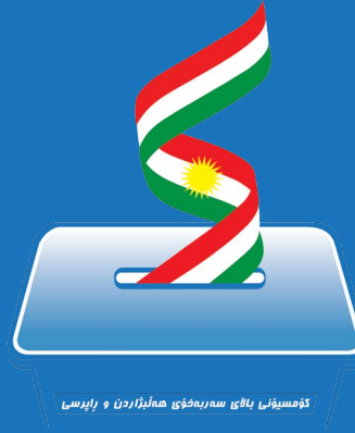
كۆمىسيۇنى بالاي سەربەخۆى ھەلئىزاردن و راپرسى

كۆمىسيۇنى بالاي سەربەخۆى ھەلئىزاردن و راپرسى المفوضية العليا المستقلة للانتخابات و الاستفتاء The Independent High Elections and Referendum Commission